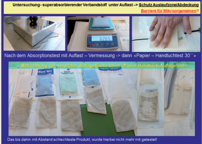
Abb. 2: Testanordnung: Verschiedenen Produkte nach kompletter Sättigung. Die auf die Rückseite aufgelegten Papierhandtücher erscheinen nach 30 Sekunden Auflagezeit bei fast allen Produkten als nass.